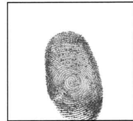
Huella Digital (índice derecho)