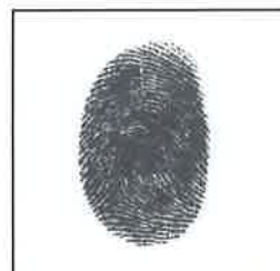
Huella Digital dedo Índice derecho